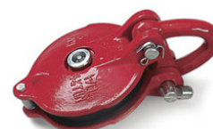
Kasteblok . 30-63490-0