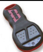
Trådløs fjernbetjening. 30-76080-0