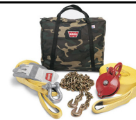
Heavy-duty tilbehørssæt 30-29460-0